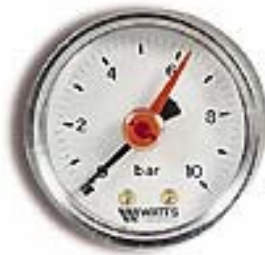
Аксиальное подсоединение MHA, MDA