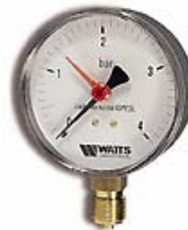
Радиальное подсоединение MHR, MDR